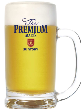
▲新発売! サントリー・ザ・プレミアム・モルツ