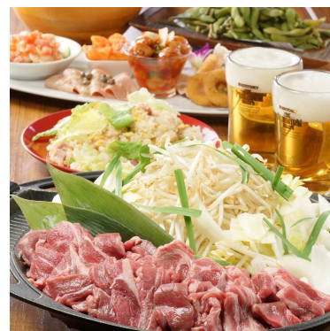
▲コース料理イメージ

TEL 06-6345-3948 12:00~21:30(休業日除く)4月3日より *電話が大変つながりにくい状態です。予約はWEB予約からお願いします。